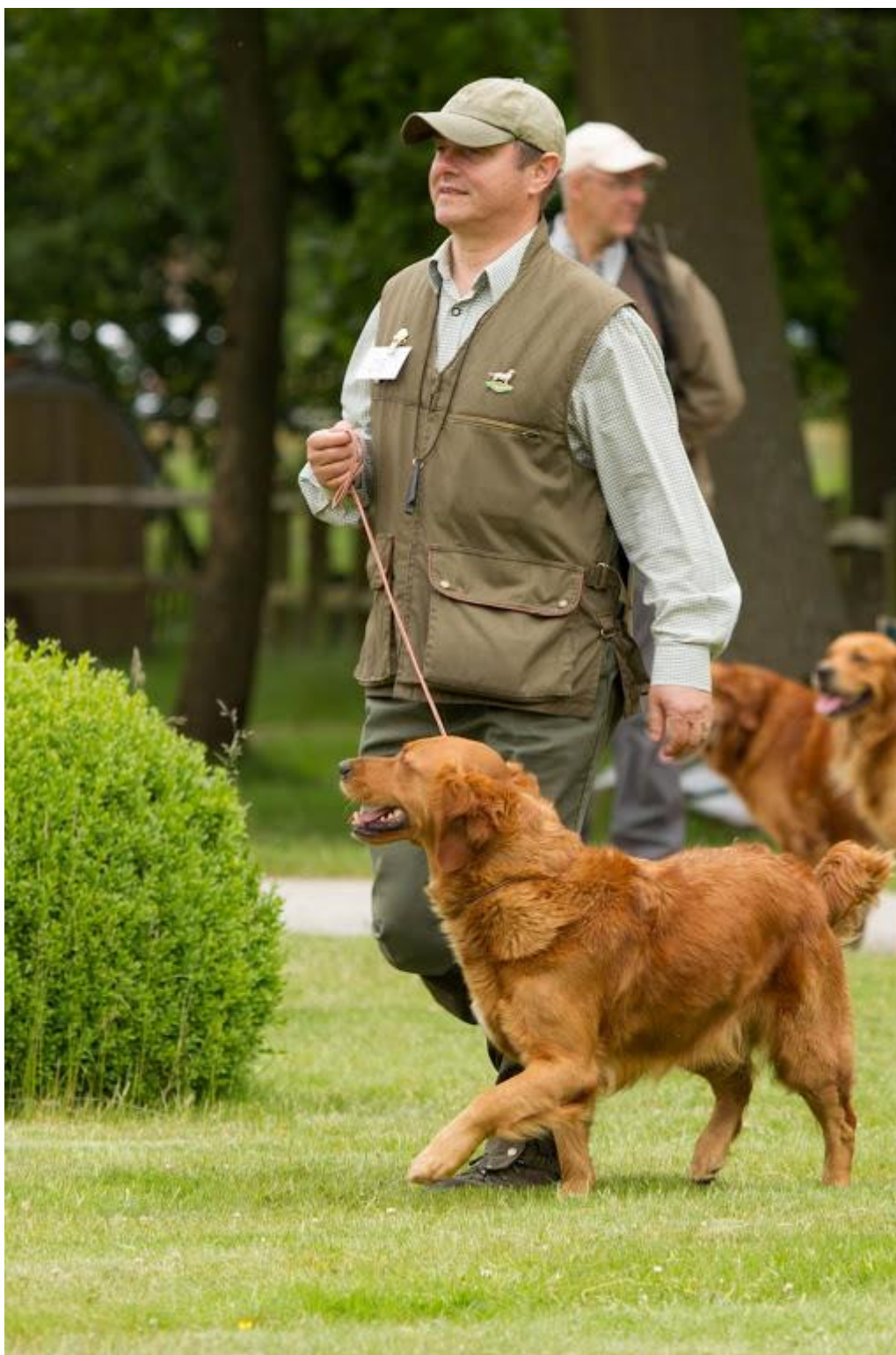
Golden Retriever teef werkljn