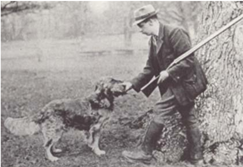
Culham Brass, b. 1904.