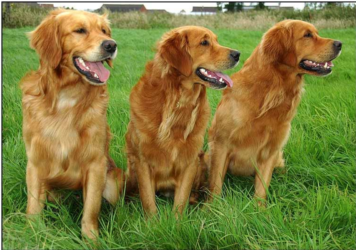
Golden Retriever reuen werkljijn.